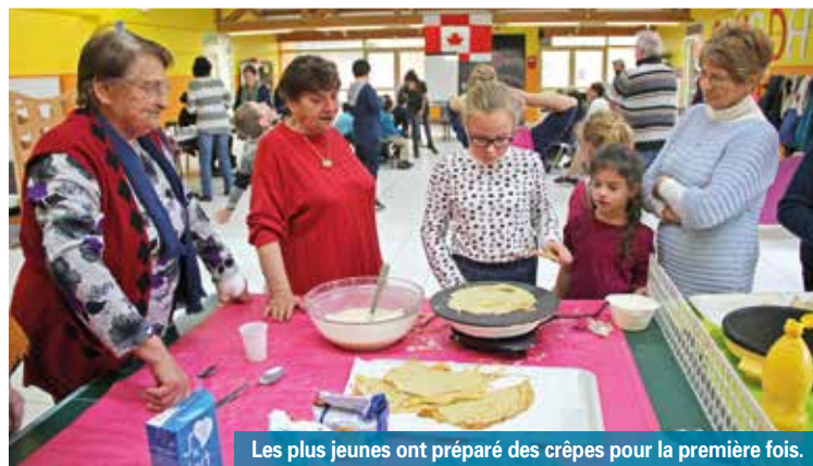
Les plus jeunes ont préparé des crêpes pour la première fois.

une dégustation à l'heure du goûter. Face au succès, ces rendez-vous vont devenir réguliers pendant les vacances scolaires et certains mercredis après-midi.