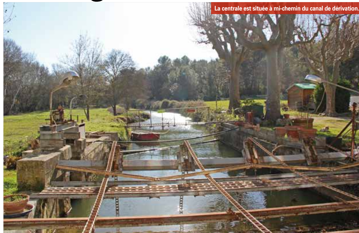
La centrale est située à mi-chemin du canal de dérivation.

Chacun pourra acquérir des parts de la société et ainsi cofinancer le projet.