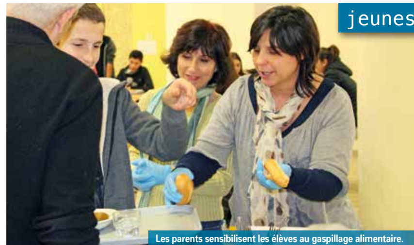
Les parents sensibilisent les élèves au gaspillage alimentaire.